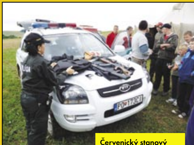
Červenický stanový tábor počas ukážky polície.