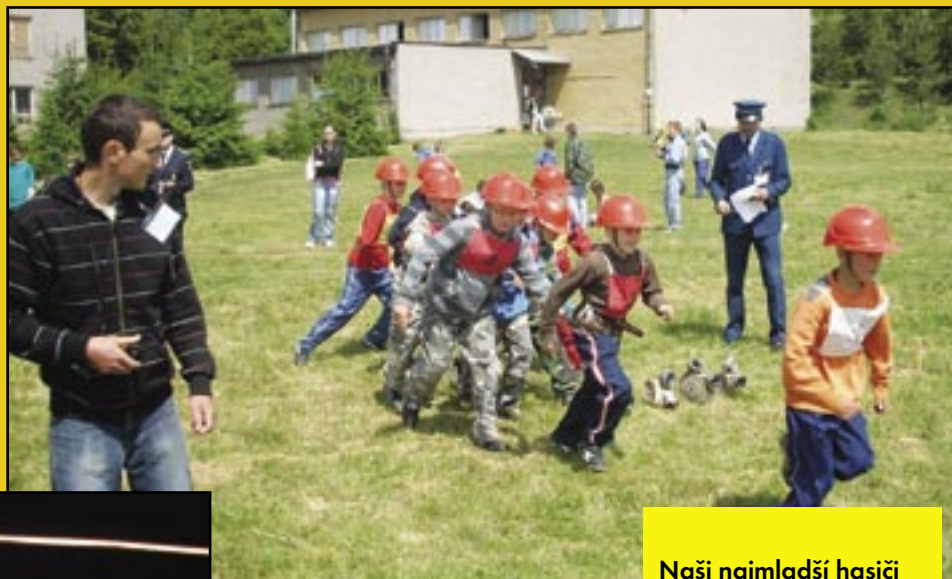
Naši najmladší hasiči počas hry Plameň.

Aj napriek tomu, že sa nám niekedy zdá, že počas roka sa v Červenici deje toho veľmi málo, predsa kultúrno-športových akcií je dostatok. Skúsme si niektoré pripomenúť: