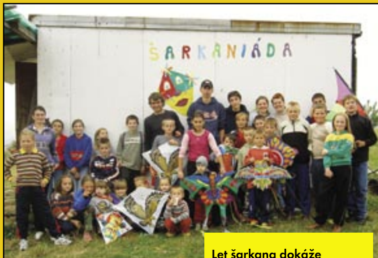
Let šarkana dokáže vyčariť úsmev na tvárach detí aj v sychravom počasí.