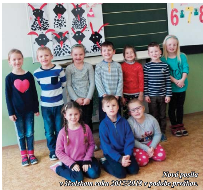
Nová posila v školskom roku 2017/2018 v podobe prváčkov.

Tieto formy majú nielen poznávaciu a edukačnú funkciu, ale prispievajú hlavne k utužovaniu kolektívu a vzájomnému spoznávaniu sa mimo priestorov školy. A to by ste sa čudovali, že na našich cestách sa niekedy navzájom nespoznávame. Sebavedomé a odvážne deti z priestorov ZŠ sa neraz menia na nasmelých „zajkov“ a deti, ktoré sú v škole tichšie, zrazu pod vplyvom nových zážitkov dostávajú krídla a preberajú vedúce pozície v kolektíve.