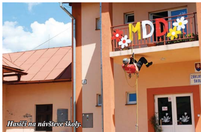
Hasiči na návšteve školy.

Ani kultúra nám nie je vzdialená a nikdy si nenecháme ujsť premiéru divadelných predstavení pre deti v Divadle Jonáša Záborského v Prešove. Veľmi dobre nás už poznajú v detskej knižnici Slniečko v Prešove a v sabinovskej knižnici. Minulý školský rok sme pridali základný plavecký výcvik pre žiakov 3. a 4. ročníkov pod profesionálnym vedením plaveckej školy Nemo z Prešova. Pekné spomienky máme aj na adrenalínové ukážky Dobrovoľného hasičského zboru v Červenici priamo u nás na školskom dvore. Ďalšia spoločná akcia s domácimi hasičmi ešte len čaká na svoju realizáciu, keďže nie sme pánmi počasias.